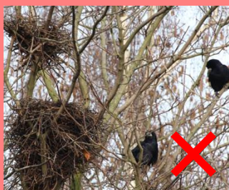
Nid de corbeau freux