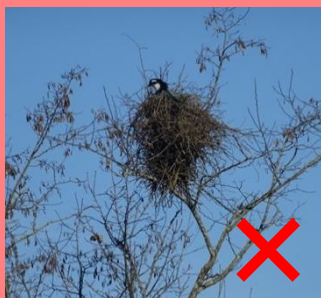
Nid de pie