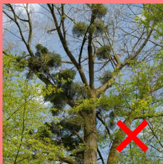
Boules de gui